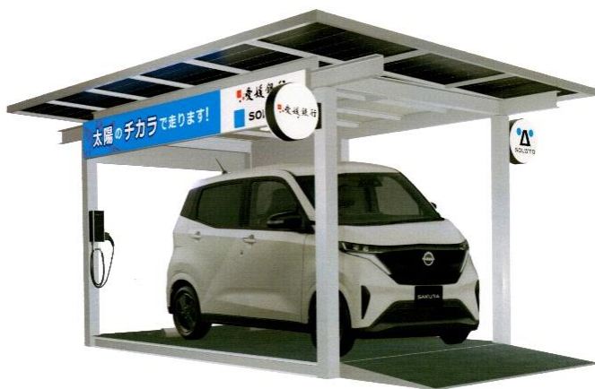
カーシェアステーションイメージ